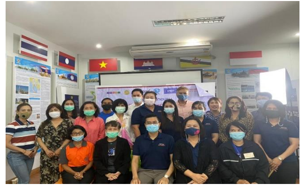
ภาพที่ 5 กลุ่มตัวอย่างในการศึกษา และผู้เข้าร่วมโครงการ “สู้โควิดด้วยทักษะการทำธุรกิจออนไลน์”