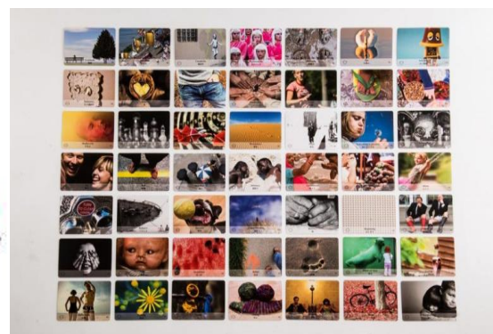
ภาพที่ 2 แสดงเครื่องมือหลักของ Points of You ได้แก่ Punctum, Journals and Planner, Faces