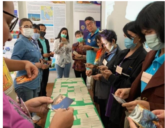
ภาพที่ 3 การเลือกโค้ชชิ่งการ์ด ตามการศึกษาการสื่อสารในกิจกรรมกลุ่มสัมพันธ์ด้วยกระบวนการโค้ชตามรูปแบบ Points of you ในการส่งเสริมการเรียนรู้ กรณีศึกษาโครงการ “สู้โควิดด้วยทักษะการทำธุรกิจออนไลน์”